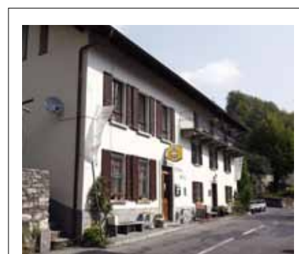
Osteria Grütli , 6659 Camedo 091 798 17 77, www.osteria-gruetli.ch

einfach etwas, wir wollen gut essen. Das geniesse ich einerseits wahnsinnig, andererseits ist es sehr schwierig, eine Auswahl zu treffen. Und dann habe ich manchmal panische Angst, dass etwas schief gehen könnte. Normalerweise funktioniert es aber. ■