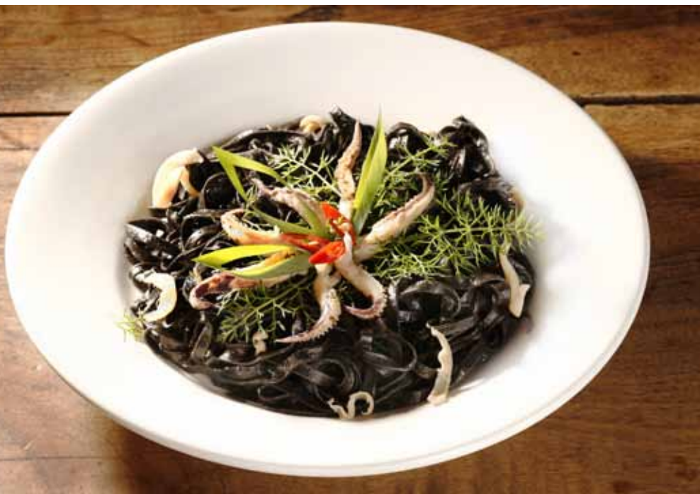
Hausgemachte Nero di seppie.