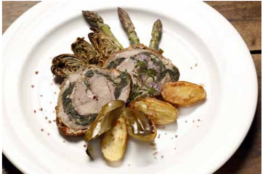
Gitzzi-Rollbraten mit Lorbeerkartoffeln und Artischockenauflauf

Gloor: Die kam erst später. In meiner ersten Zeit in Apulien schloss noch nie-